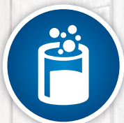
水溶性的起泡晶体