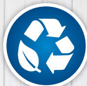
可生物降解及 经皮肤病学家测试的配方