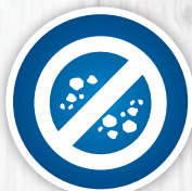
不留有害残余物，不会刺激敏感肌肤