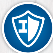
腐蚀抑制剂 保护衣物和器具的金属部件